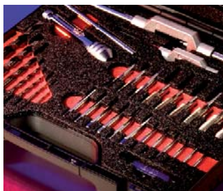
2-farbiges "Tool-Control-System" 2-coloured "Tool-Control-System"