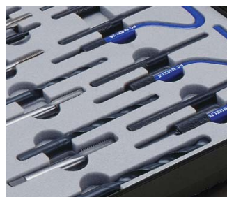
Schaumstoffinlays herausnehmbar Removable inlays