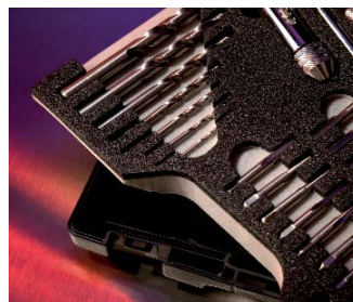
Schaumstoffinlays herausnehmbar Removable inlays