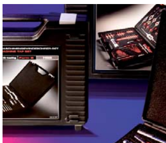
Innovatives Produktdesign Innovative product design