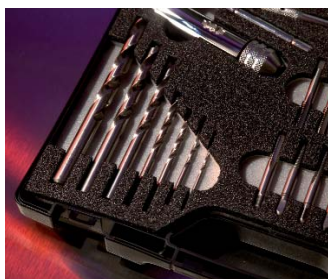
Optimiertes Werkzeugkonzept Optimised tool configuration