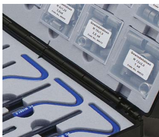
Optimiertes Werkzeugkonzept Optimised tool configuration