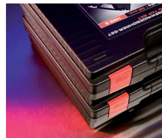
Koffer rutschsicher und stapelbar Non-slip and stackable toolboxes