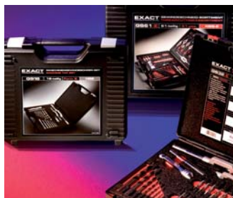
Innovatives Produktdesign Innovative product design